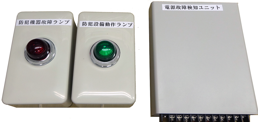
防犯カメラ機器用 電源 DC12V 5A DCプラグタイプ

監視カメラ設備の故障は電源トラブル・録画機のハードディスク故障・防犯カメラ本体の故障が殆どを占めます。